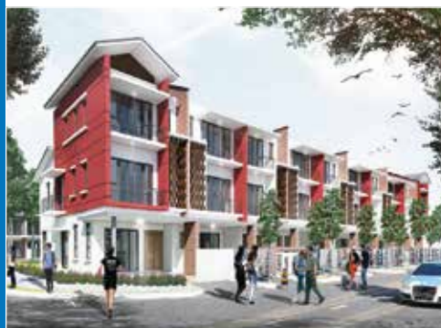
THIEN MY LOC QUANG NGAI SUN CASA BINH DUONG