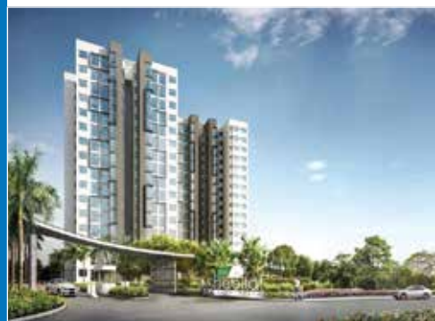
THE HABITAT 平陽